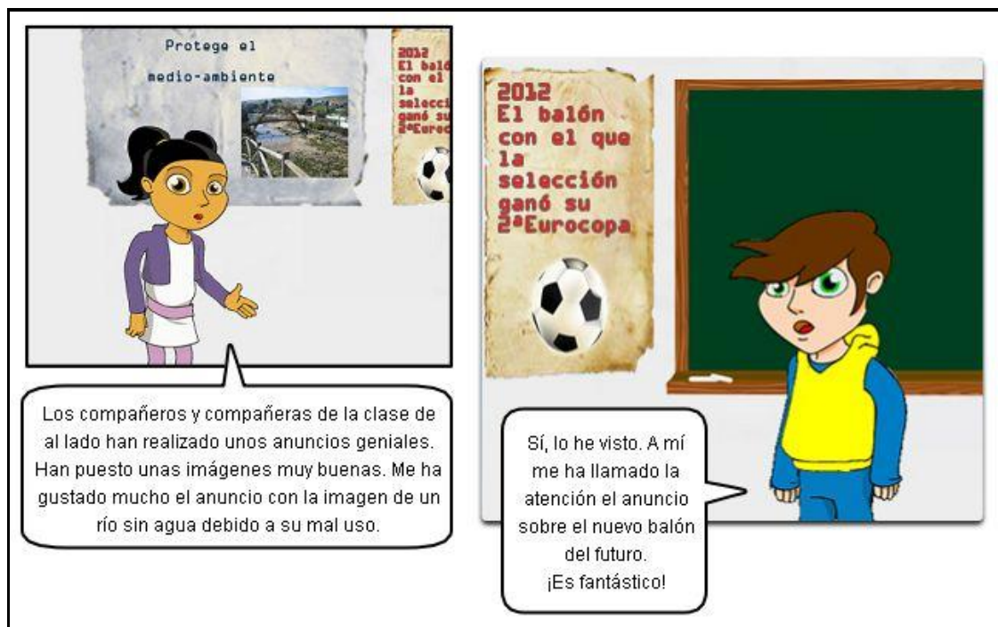
Ilustración. Recursos no verbales.