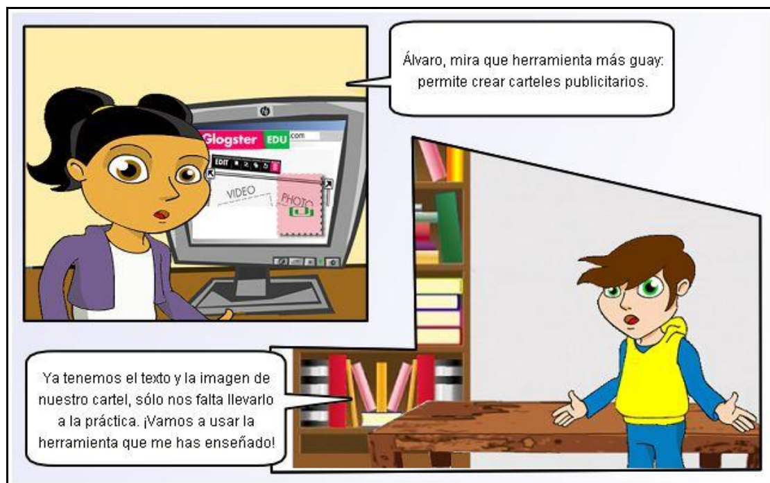
Ilustración. Elaboración de cartel publicitario.