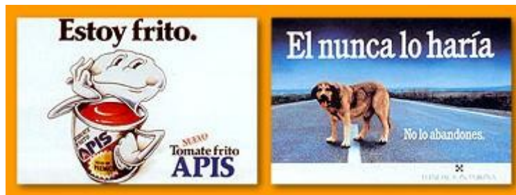
Captura de pantalla del cartel publicitario.

En este apartado el alumnado trabajará en pareja para analizar varios anuncios publicitarios facilitados por el docente. Se aportan a modo de ejemplo los siguientes anuncios ofrecidos en la dirección web del muvap: