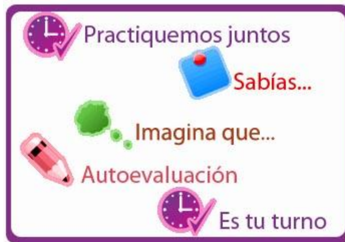
Ilustración. Orientaciones metodológicas.

El recurso también incluye un apartado "Autoevaluación" para que el alumnado de forma autónoma pueda comprobar si ha adquirido los conocimientos correctamente